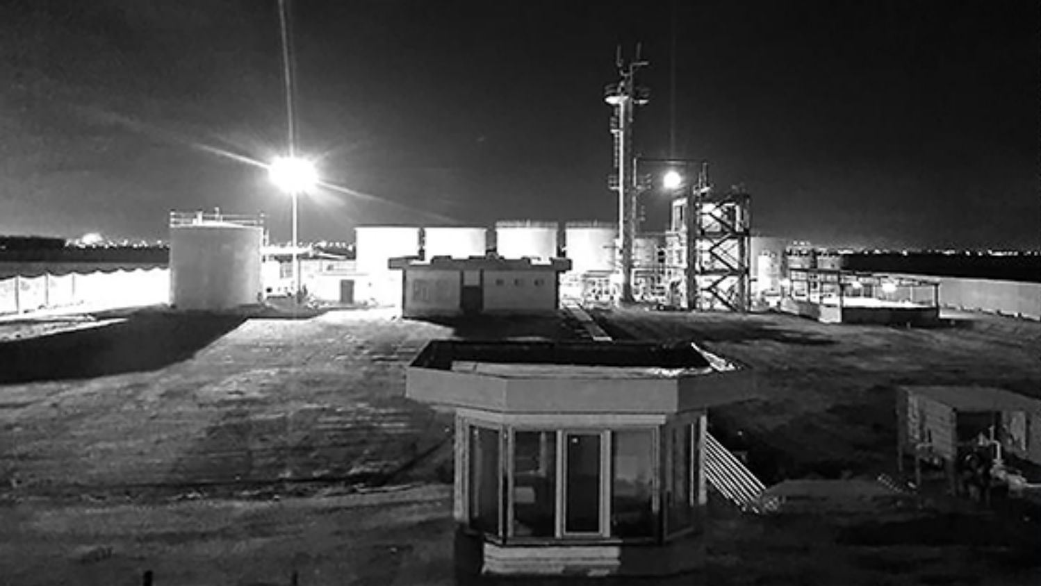
⑤ پالایشگاه میعانات گازی (در حال احداث)